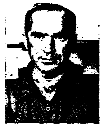
البرلمان التركي يفشل في انتخاب رئيس جديد

واشنطن - أعلن اللية الممثلة الرئيس الأميركي جيمي كارتر رسمياً قطع العلاقات الدبلوماسية بين بلاده وإيران، والطلب من الدبلوماسيين في السفارة الإيرانية في واشنطن مغادرة الولايات المتحدة في موعد أقصاه منتصف هذه الليلة.